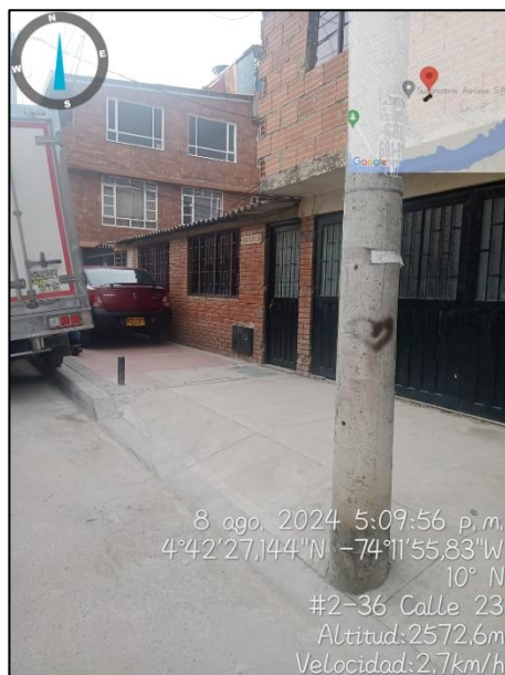
Ilustración 2. Seguimiento limpieza

C.P. 250020 Tel. +57(1) 823 40 70 823 40 71 / 823 40 73 Fax. + 57(1) 825 76 20 Dir. Cra. 14 No. 13-05