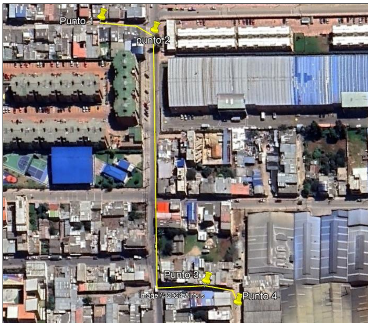
Ilustración 1. Recorrido verificación ambiental

Se realizó recorrido de control y vigilancia en el cuadrante 1, barrio HATO Segundo Sector el día 06 de agosto del 2024, desde las coordenadas 4°42'27,336"N- 74°11'55,632"W hasta las coordenadas 4°42'21,648"N- 74°12'0,114"W (ver ilustración 1. Ruta amarilla), con el fin de verificar las condiciones ambientales, identificar posibles afectaciones a los recursos naturales y realizar las acciones de prevención correspondientes.